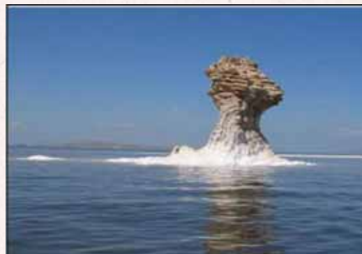
۱. نمایی از دریاچه ارومیه

ایران، به دلایل زیر، یکی از پنج کشور بهره‌مند از تنوع زیستی کامل (داشتن چهار فصل و زیست‌گونه‌های اصلی گیاهی و جانوری) به‌شمار می‌آید. وجود بزرگ‌ترین دریاچه جهان در شمال این کشور، خط ساحلی ۱۲۰۰ کیلومتری خلیج فارس، داشتن ۵۰ دریاچه که از میان آن‌ها ۱۸ دریاچه در شمار دریاچه‌های کنوانسیون بین‌المللی رامسر قرار دارند، دریاچه ارومیه (شکل ۱) که به‌عنوان یکی از ۵۹ ذخیره زیستی کره زمین شناخته شده است، وجود بازمانده‌های جنگل‌های هیرکانی در شمال‌غرب مازندران مربوط به ۱۰ هزار سال پیش، بیابان‌ها و کویرهایی با مناظر بدیع مانند کلوت‌ها در حاشیه غربی بیابان لوت، که به بزرگ‌ترین شهر کلوخی جهان مشهور است، تالاب‌های بین‌المللی شبه‌جزیره میانکاله، خلیج گرگان، دریاچه پریشان، غارها، آبشارها، چشمه‌های آب معدنی و روستاهایی با جاذبه‌های ویژه همانند کندوان، ماسوله و غیره. این‌ها همه از جاذبه‌ها